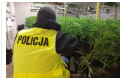
Zdjęcie: KWP w Gorzowie Wielkopolskim #5