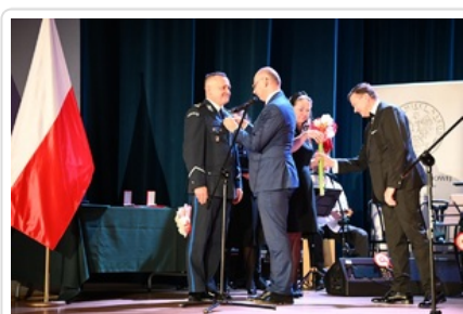
Uroczystość wręczenia Nagrody Honorowej IPN „Świadek Historii”