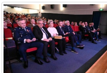
Uroczystość wręczenia Nagrody Honorowej IPN „Świadek Historii”