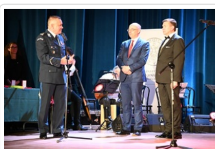
Uroczystość wręczenia Nagrody Honorowej IPN „Świadek Historii”