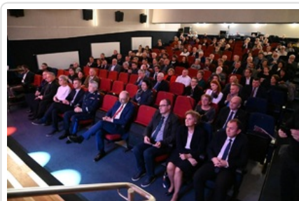
Uroczystość wręczenia Nagrody Honorowej IPN „Świadek Historii”