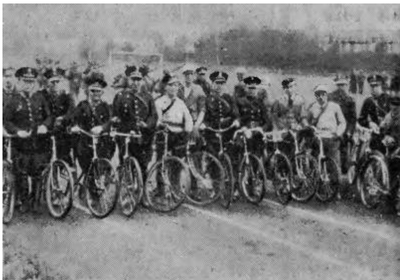
Drużyna Policji Państwowej w Jarosławiu, która w biegu kolarskim w maskach, zorganizowanym w ramach XIII Tygodnia Ligi Obrony Powietrznej i Przeciwgazowej zajęła I miejsce - 1936 r.