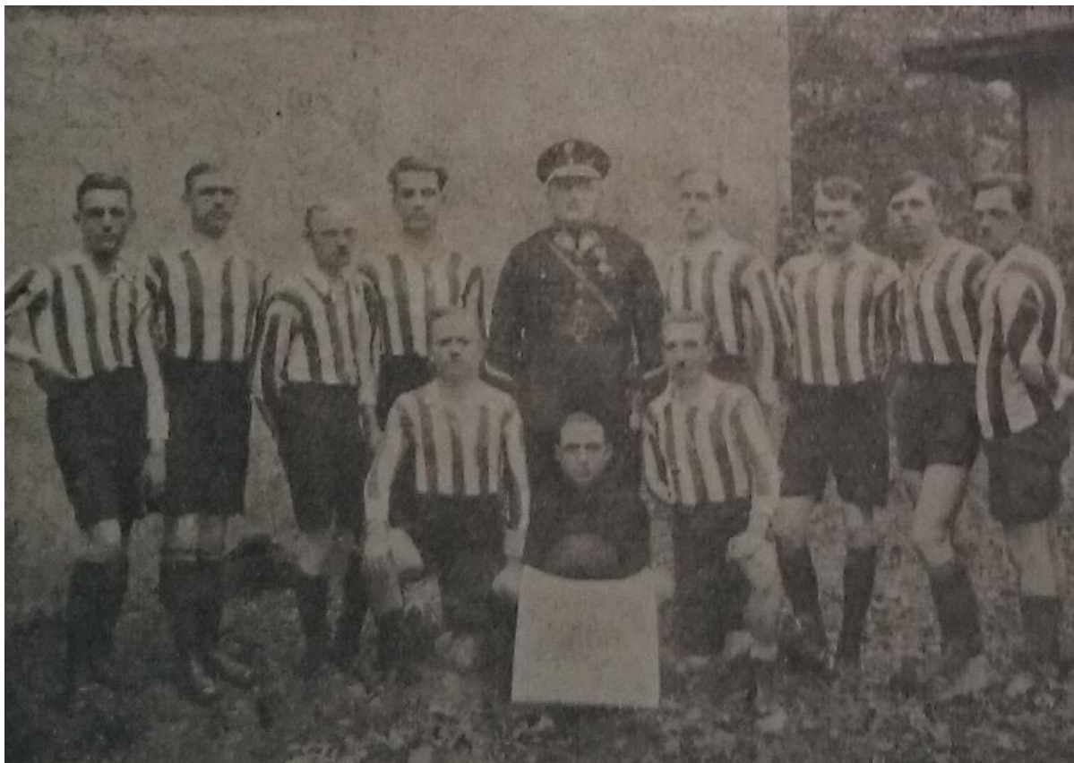
Policyjna drużyna piłki nożnej w Jarosławiu (zdz. Rocznik Policji Państwowej 1927)