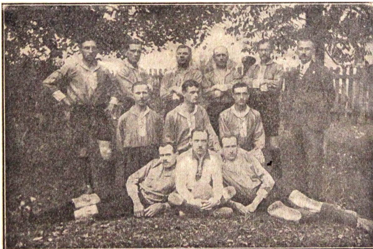
Policyjna drużyna piłki nożnej w Rzeszowie (zdz. Rocznik Policji Państwowej 1927)

Ważnym czynnikiem w służbie policyjnej była sprawność fizyczna, która miała istotny wpływ na realizację powierzonych