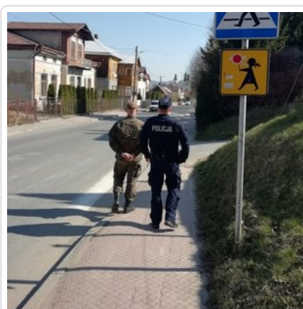
Łączone patrole służb mundurowych

Policjanci apelują o odpowiedzialne i rozsądne zachowanie, w tym o przestrzeganie wprowadzonych ograniczeń, współpracę i realizowanie poleceń służb. Pamiętając, że ograniczenie kontaktów i unikanie skupisk ludzkich, to jedna z podstawowych zasad w walce z epidemią.