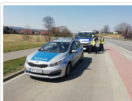
Łączone patrole służb mundurowych