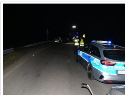
wypadek Osobnica