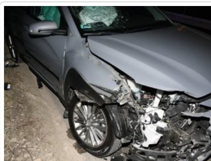
wypadek Osobnica