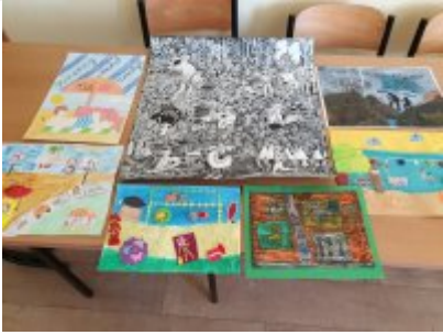
zwycięskie prace plastyczne